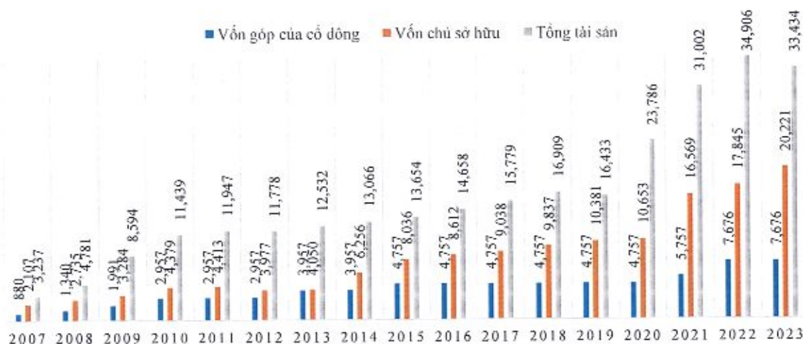
Biểu đồ tăng trưởng Vốn và Tài sản kể từ khi niêm yết đến nay

Tại ngày 31/12/2023: Tổng tài sản của toàn Tập đoàn đạt 33.434,22 tỷ đồng , giảm thuần 1.472,29 tỷ đồng, tương đương mức giảm 4,22% so với năm 2022. Trong đó, các khoản mục chủ yếu làm biến động tài sản bao gồm: